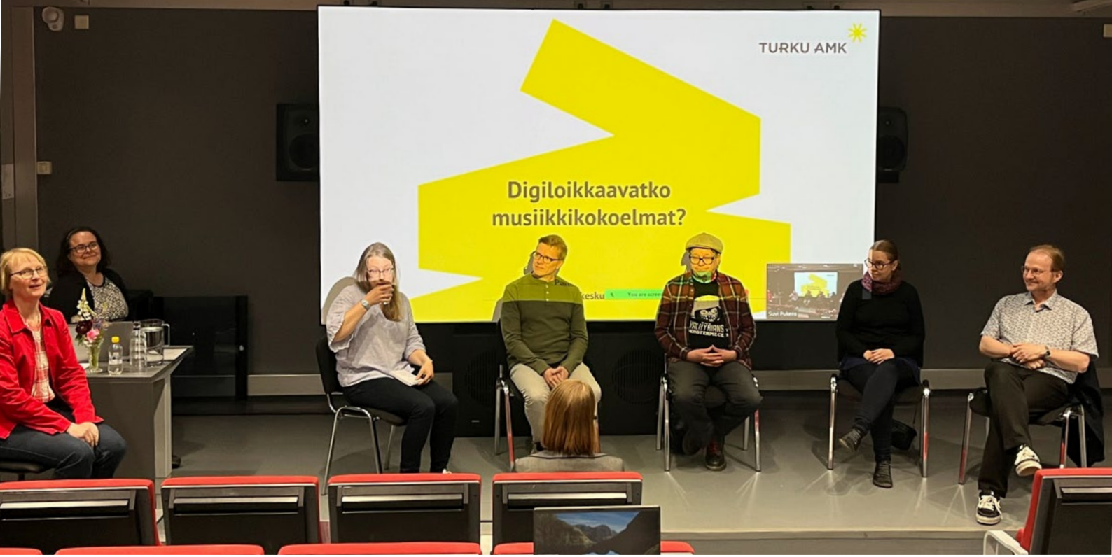
Paneelikeskustelu on alkamassa.

toiseen. Nuottiaineiston osalta ei myöskään ole tarvetta tehdä poistoja aineiston vanhenemisen vuoksi, 1700-luvun sävellykset ovat aivan yhtä relevantteja kuin nykysävellykset. Yleisesti todettiin, että verkossa avoimesti olevat palvelut, kuten IMSLP saattavat jopa korvata hankinnan tarpeen. Musiikkia myös harrastetaan, ja soittamaan sekä laulamaan opetellaan nykyisin monilla erilaisilla tavoilla, kuten esimerkiksi Rockway.fi-musiikkipalvelun avulla, joka tarjoaa myös nuotit opetuksen tueksi. Panelistit totesivat myös tarpeiden erilaisuuden yleisten ja erikoiskirjastojen välillä vaikuttavan hankintojen tekemiseen.