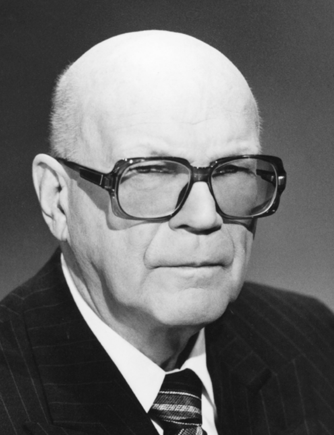
Presidentti Urho Kaleva Kekkonen .