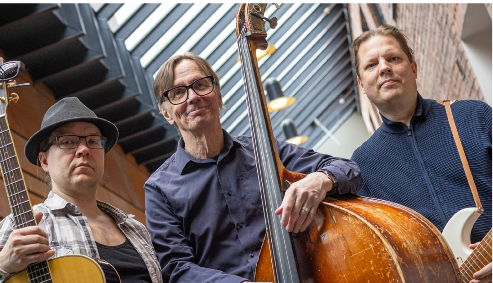
Kunnan Pojat – Rovaniemen viralliset rytmimuusikot.