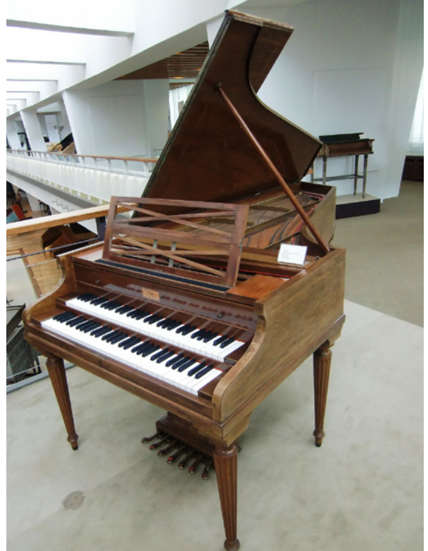
Pleyel Grand Modèle de Concert vuodelta 1927.

Yleisön ja kriitikoiden ylistämät cembaloresitaalit, urauurtavat äänitykset sekä kirjan La musique ancienne vuonna 1924 julkaistu englanninkielinen käännös Music of the Past loivat pohjaa ilmiölle, jota 1900-luvun puolivälin paikkeilla alettiin kutsua nimellä Historically Informed Performance . Tämän vanhan musiikin liikkeen keskeinen ajatus on, että menneinä vuosisatoina sävellettyä musiikkia tulee esittää vain sävellysaikakauden mukaisilla periodisoittimilla ja aikakauden autenttisiin esityskäytäntöihin perehtyen.