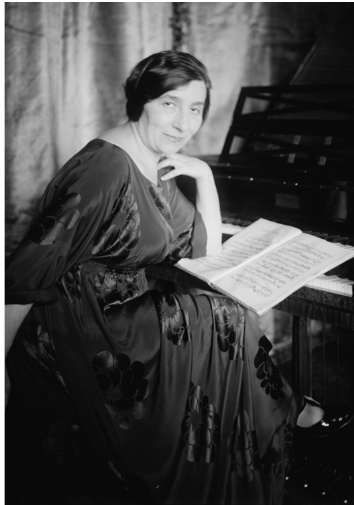
Wanda Landowska noin vuonna 1923.

Pariisissa Landowska tutustui Pleyel-piano- tehtaan alun perin vuonna 1889 esittelemään uudenaikaiseen konsertticembaloon, joka oli kuin nykyaikainen versio hänen Berliinissä