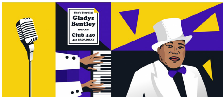
Smithsonian Institution: Singing Gender-Bending Blues . Sidedoor Season 3. Podcast.

Sidedoor-podcastissa on ilmestynyt myös muutamia musiikkiin liittyviä tarinoita. Singing Gender-Bending Blues kertoo laulajasta nimeltä Gladys Bentley . ■